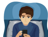
Alteración del sueño